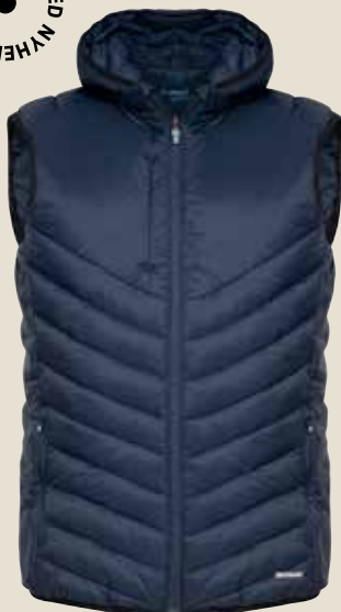
351482 M | 351483 W C&B | MOUNT ADAMS VEST

MATERIALE: Skal: 100% recycled nylon. For: 100% recycled polyester. Lining: 100% recycled nylon VEJL. PRIS: 879,-