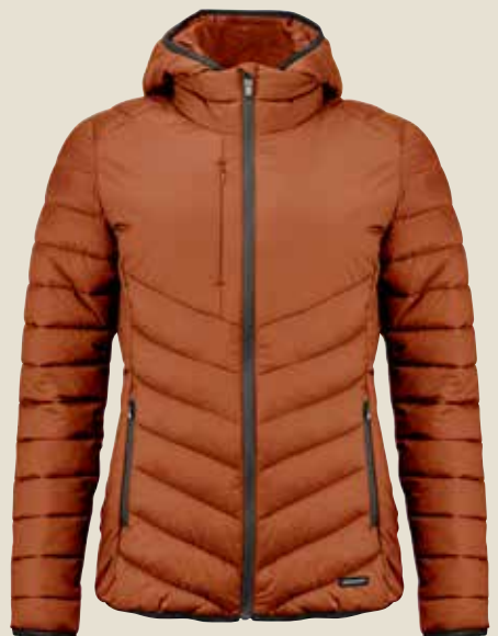
351474 M | 351475 W C&B | MOUNT ADAMS JACKET

MATERIALE: Skal: 100% recycled nylon. For: 100% recycled polyester. Lining: 100% recycled nylon VEJL. PRIS: 879,-